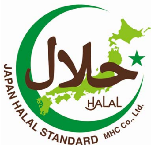
▲MHC社が発行するハラールマーク。アラビア語で中央に「ハラール」と書かれている

ハラール認証機関はハラールマークの相互認証を行っているため、認証を取得した国以外でも有効です。現在、JAKIMが認証したり、相互認証しているハラール製品は世界57カ国で受け入れられており、マレーシアの国益を支える大きな貿易ビジネスとして発展しています。例えば、インドネシアのハラールマークはインドネシアだけでなく、マレーシアやタイなど相互認証されている国でも認められ、輸出も可能。イスラム市場への進出には、どのハラール認証を取得するのが大きな鍵となります。